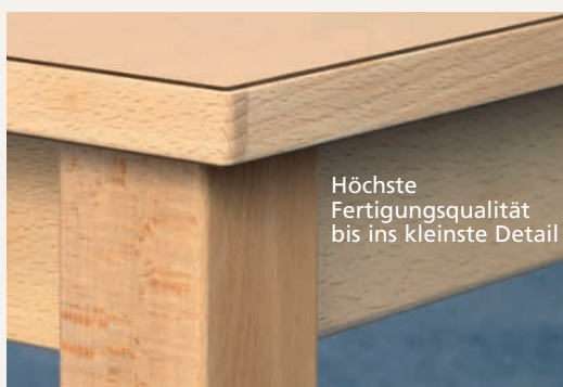
Höchste Fertigungsqualität bis ins kleinste Detail